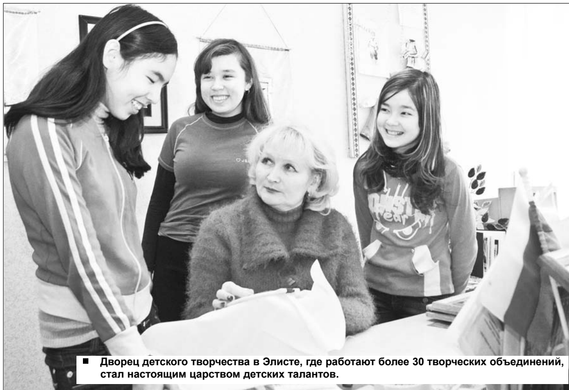
Дворец детского творчества в Элисте, где работают более 30 творческих объединений, стал настоящим царством детских талантов.