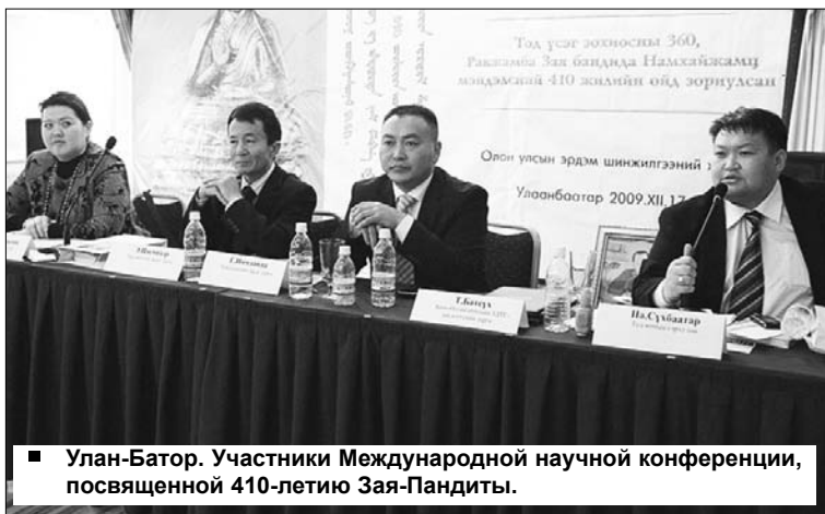
■ Улан-Батор. Участники Международной научной конференции, посвященной 410-летию Зая-Пандиты.

Конференцию, на которую собрались 200 участников, открыл председатель правления Центра "Тод номын гэрэл" и Монгольско-калмыцкого культурно-экономи-