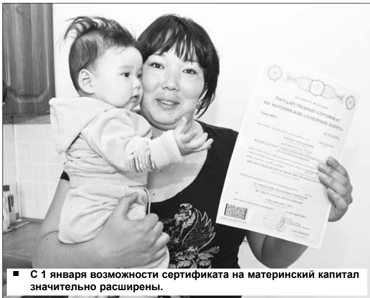
■ С 1 января возможности сертификата на материнский капитал значительно расширены.

Теперь производители и дистрибьюторы обязаны регистрировать в Росздравнадзоре предельную отпускную цену на каждый препарат из перечня Минздравсоцразвития. Процесс регистрации начался в понедельник и продлится до 1 апреля.