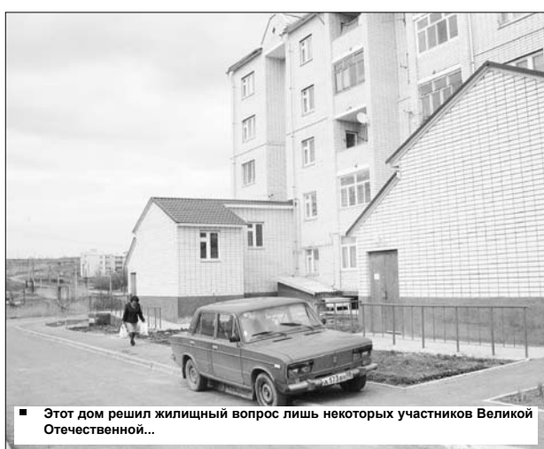
Этот дом решил жилищный вопрос лишь некоторых участников Великой Отечественной...